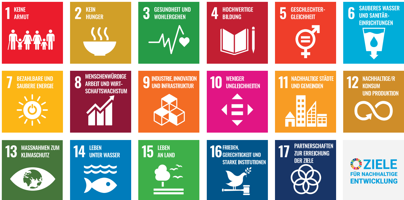
Abb.: Die 17 Nachhaltigkeitsziele der UN.